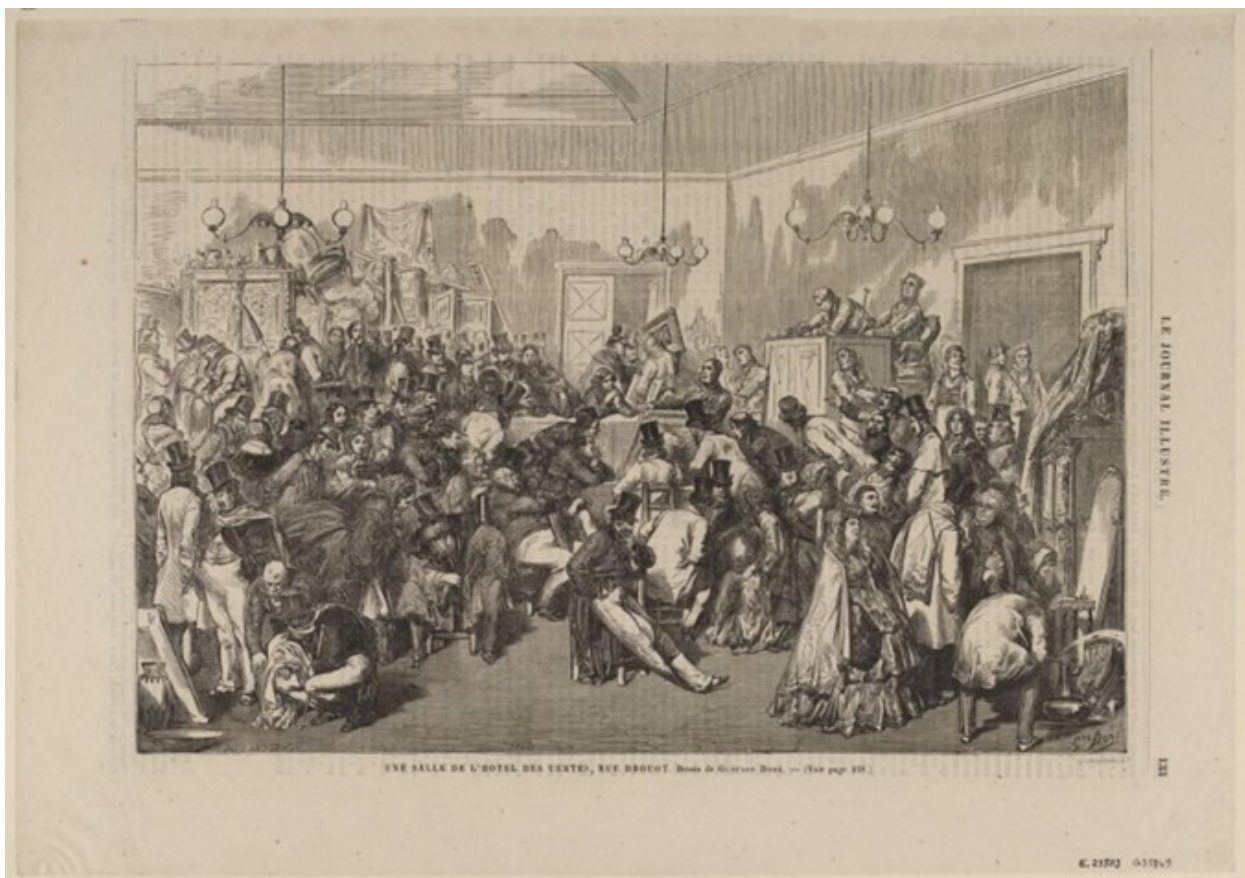
Une salle des ventes de l'hôtel Drouot.

Le tribunal correctionnel de Paris prononça des peines allant jusqu'à trois ans de prison, dont certaines avec sursis, et des amendes pouvant atteindre 60 000 euros. Onze des quarante-neuf prévenus furent relaxés. L'UCHV, dont les 110 commissionnaires étaient actionnaires à parts égales, fut dissoute et condamnée à une amende de 220 000 euros. Les commissionnaires non mis en examen tentèrent de se regrouper au sein d'une nouvelle structure pour répondre à l'appel d'offres de Drouot, mais c'est la société Chenue qui remporta le marché à l'unanimité, mettant fin à 150 ans de liens entre la prestigieuse maison d'enchères et ses emblématiques cols rouges savoyards.