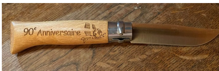
L'Opinel 90 em Anniversaire : 14 euros + frais de port.

Également en vente: Bruno Dumont: fabl69@orange.fr