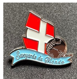
Le Pin's des