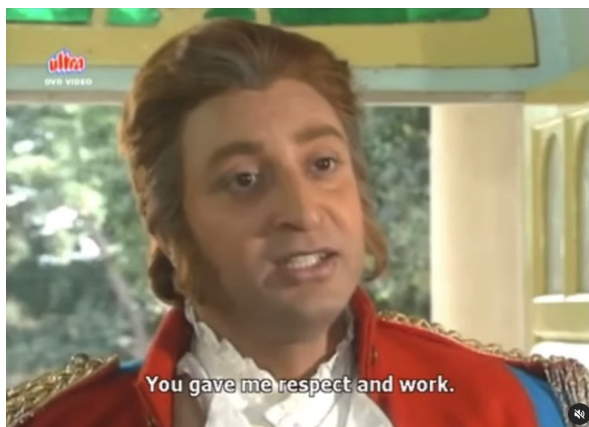
De Boigne, joué par un acteur Indien dans "The Great

À travers cette soirée, nous avons non seulement célébré les saveurs de notre terroir, mais aussi ravivé la mémoire d'une aventure extraordinaire, qui illustre l'influence et l'esprit d'audace des Savoyards à travers le monde.