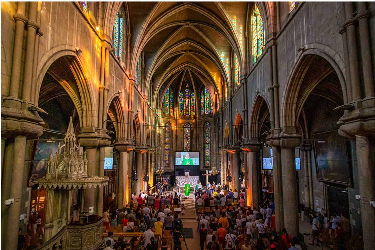
Eglise Ste Blandine