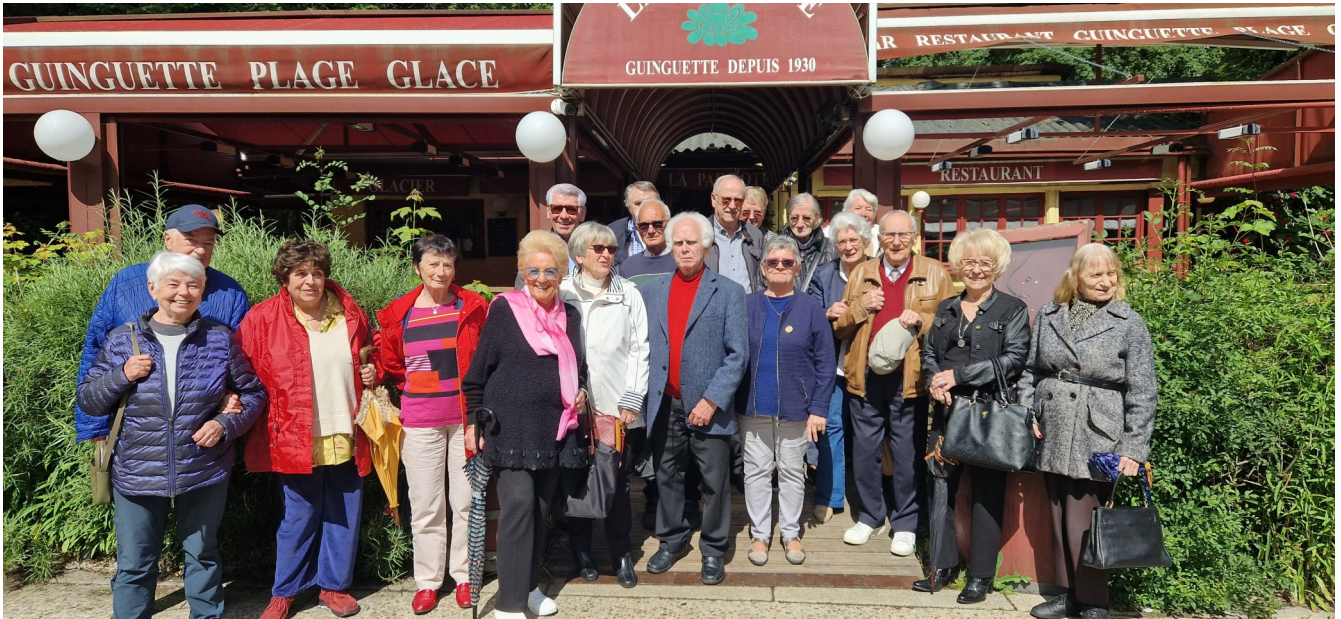
En bord de Saône