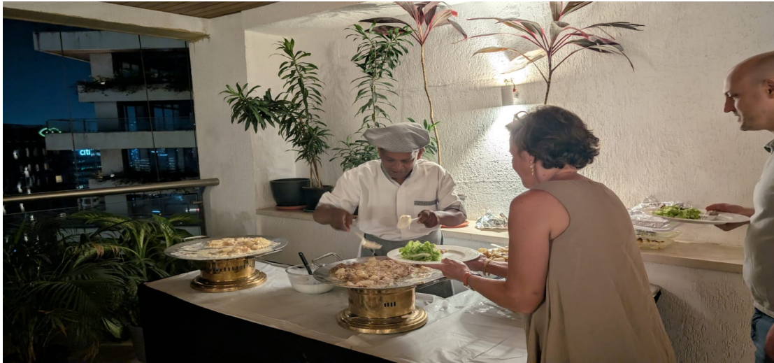
Au programme tartiflette traditionnelle et végétarienne pour nos invités de confession hindouiste.